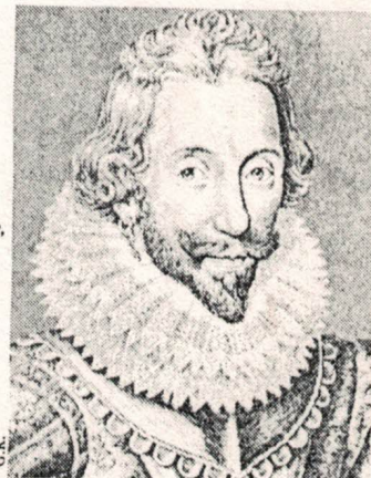
De graaf van Southampton.

He clapped his plump cheeks, with his tresses played, And smiling wantonly, his love betrayed. He watched his arms, and as they opened wide, At every stroke, betwixt them he would slide, And steal a kiss, and then run out and dance, And as he turned, cast many a lustful glance, And throw him gaudy toys to please his eye,