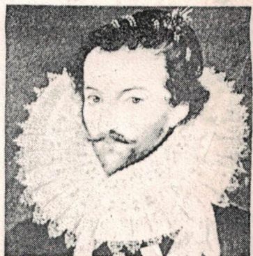
Sir Walter Raleigh.

De toneeldichter schreef zijn drama's in rijmloze verzen. Marlowe moet ook een tamelijk open homoseksueel geweest zijn. Over directe relaties is niets feitelijk bekend. Zijn hang naar mannelijke schoonheid ging verder en dieper dan die van zijn rivaal Shakespeare. Hij werd gefascineerd door homoseksualiteit: dat toont zijn werk steeds weer aan. Nergens anders dan in 'Edward II' is er in de Engelse literatuur op een dergelijke manier de liefde van een homoseksuele koning voor zijn lieveling beter voorgesteld. Alle sympathie gaat naar Edward. Het is ook het eerste werk in de 'nieuwe literatuur', waarin erotiek tussen twee mannen gelijk staat aan die tussen man en vrouw. Het liefdesverhaal 'Hero and Leander' is overgoten met homo-erotiek, die daarnaast zowel voorkomt in zijn drama's 'Edward II', 'The massacre at Paris' als in zijn ballade 'Come live with me, and be my love', waarvan eeuwen niemand vermoed heeft, dat het op een man sloeg. Het gegeven ontleende Marlowe aan Vergilius. Corydon nodigt Alexis uit, met hem te leven en zijn lief te zijn. Zo'n persoonsomzetting bij literaire thema's komt vaker voor. Het homoseksuele element kenmerkt weer Renaissance-Marlowe. De intensie en de structuur van de zin 'Come live with me...' schreef Marlowe ook in Edward II: 'Then live and be the favourite of a king.'